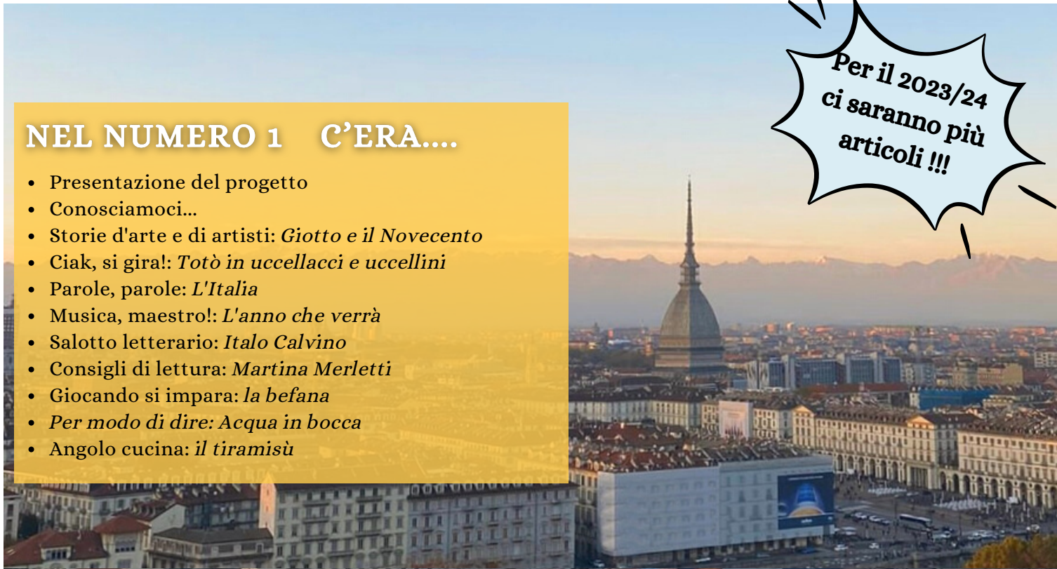
Torino, vista dal Monte dei Cappuccini - inverno 2021

Per il 2023/24 ci saranno più articoli !!!